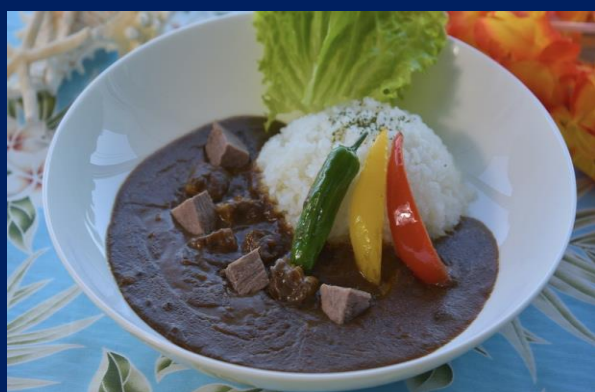
Beef Curry 特製牛肉咖哩 オリジナルビーフカレー ¥1,600