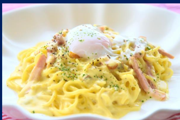
Carbonara 溫泉蛋奶油培根義大利麵 半熟卵のカルボナーラ ¥1,600

All prices include consumption tax. A 13% service charge will be added to your bill at the time of payment.