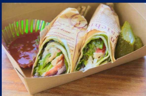
Burrito Chiken 雞肉墨西哥捲餅 ブリトー チキン ¥1,500