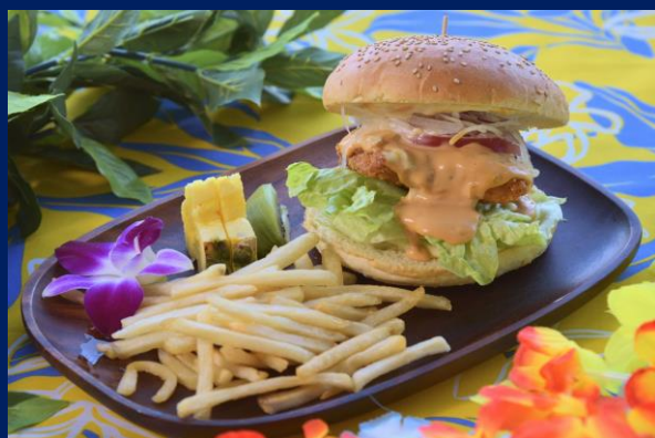
Golden-Eyed Snapper burger 金目鯛漢堡 金目鯛バーガー ¥1,800