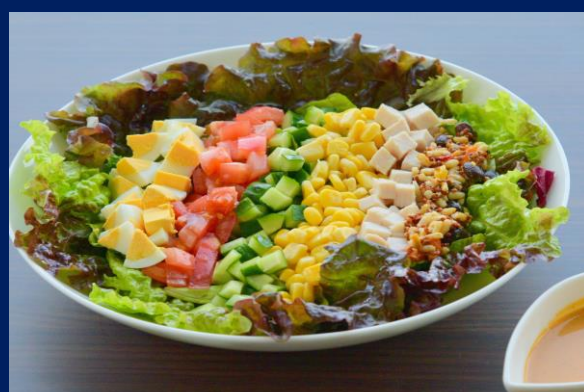
Cobb Salad 考伯沙拉 コブサラダ ¥1,600